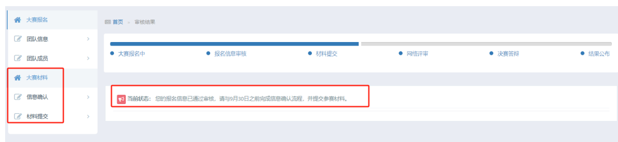
图 12 报名申请审核通过

8. 报名审核通过后，状态显示为“您的团队报名信息已通过审核”，请于指定日期内确认团队信息，上传参赛材料。同时，左侧栏会出现“大赛材料”部分。如图 12。