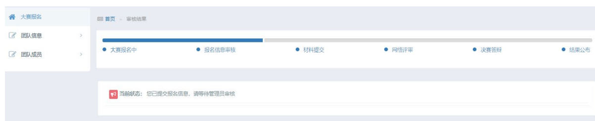
图 11 报名申请审核中

8. 报名审核通过后，状态显示为“您的团队报名信息已通过审核”，请于指定日期内确认团队信息，上传参赛材料。同时，左侧栏会出现“大赛材料”部分。如图 12。