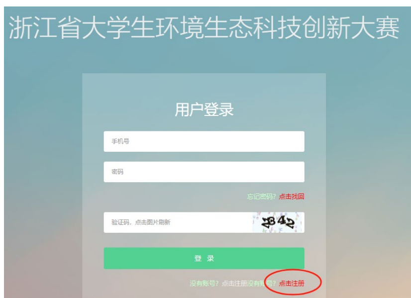
图 2 用户注册登录页面