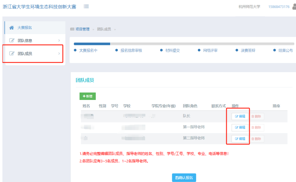
图 7 完善队长和指导老师信息

5.完善团队成员，添加其他成员：在“团队成员”页面，点击操作区“编辑”，完善队长和指导老师的其他信息，如图 7；点击“+ 新增”，添加团队其他成员，如图 8。