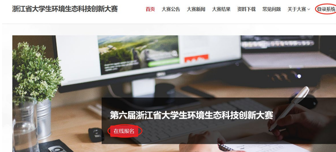
图 1 竞赛报名入口

1. 用户注册：打开竞赛官网（ http://www.ziceesti.com/public/index.php ），点击首页“在线报名”或者右上角“登陆系统”，如图 1：