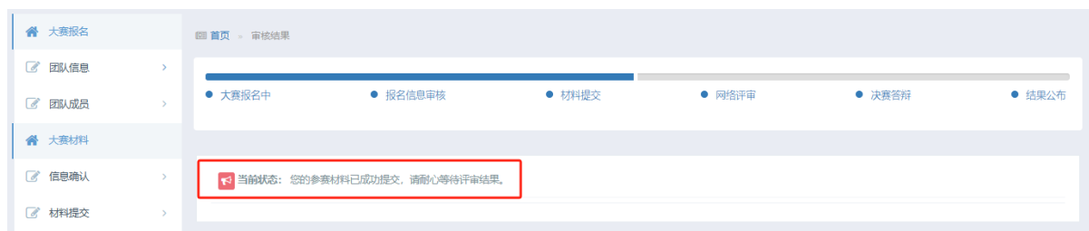
图 17 参赛材料成功提交

3. 参赛材料上传后，状态栏显示“参赛材料成功提交”，秘书处会对作品进行形式审查，并组织网络评审，如图 17，请耐心等待评审结果。