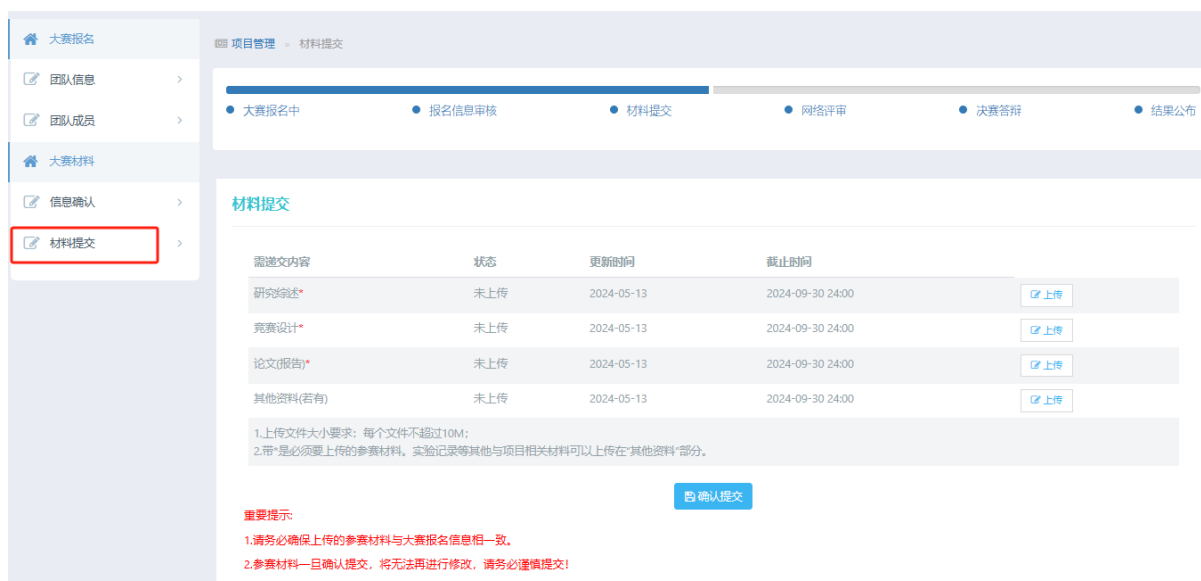
图 16 参赛材料上传