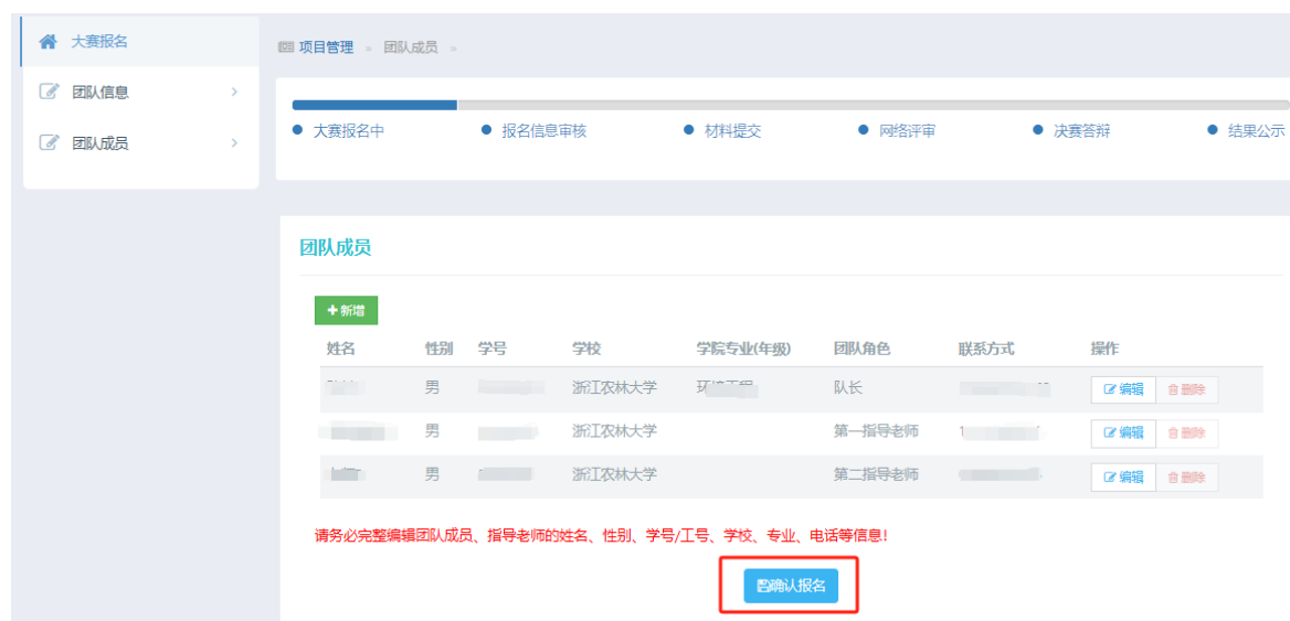
图 10 确认报名